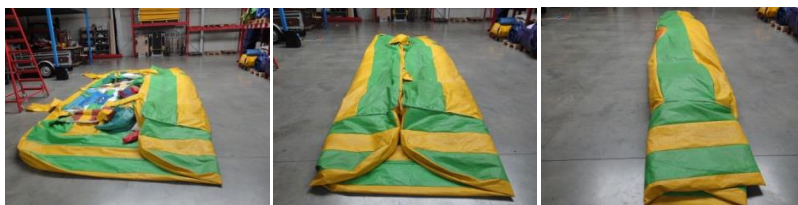
Dichtvouwen in 3 keer