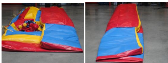
Dichtvouwen in 2 keer